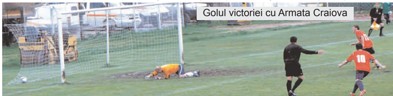
Golul victoriei cu Armata Craiova

La sfârșitul acestui sezon vor retrograda din liga III echipele de pe locurile 13-18 din fiecare serie. Sistemul competițional pentru 2009/2010 și 2010/2011 a fost aprobat de Adunarea Generală a FRF din data de 11 mai 2009 și aduce câteva schimbări importante, începând cu acest sezon. În Liga a III-a retrogradează direct echipele clasate pe locurile 13, 14, 15, 16, 17 și 18 din fiecare serie, plus o echipă de pe locul 12, mai slab clasată (în total, din divizia C vor retrograda 37 de echipe din cele șase serii!). Pentru stabilirea echipei de pe locul 12 care va retrograda, pentru fiecare serie se va alcătui un clasament special numai pe baza rezultatelor obținute de echipele de pe locul 12 în jocurile cu echipele de pe locurile 1-11.