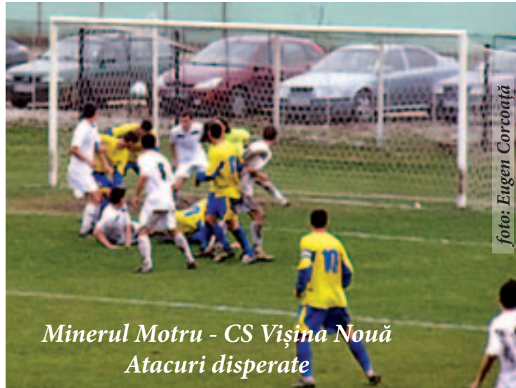
Minerul Motru - CS Vișina Nouă Atacuri disperate

26 noiembrie ora 14:00 Jiul Rovinari - Minerul Motru 3 decembrie ora 14:00 Minerul Motru - FC Drobeta Tr. Severin