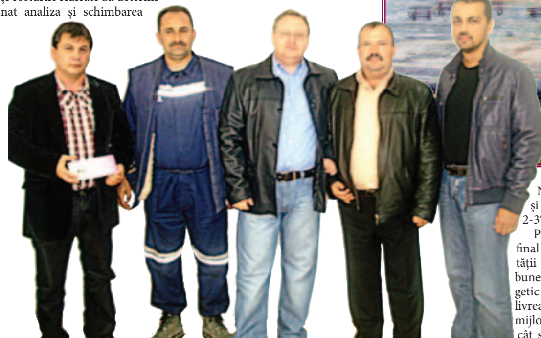
Lideri: de la sindicat la Parlament

direcția N - 20° - E și căderi de 2-3° spre SE