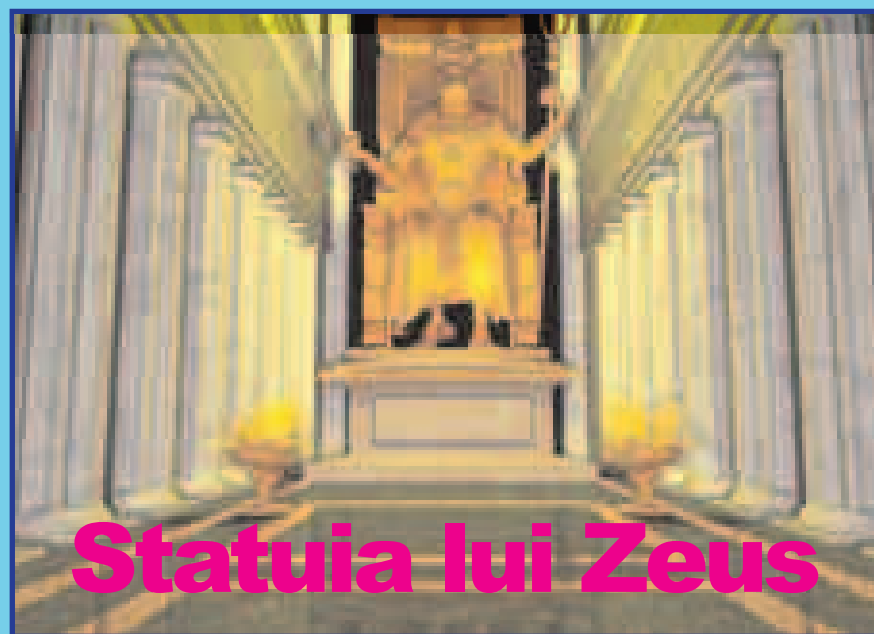
Statuia lui Zeus

Devenit în timp neîncăpător, templul a fost reconstruit într-o suprafață mai mare iar sculptorul grec Phidias a ridicat o statuie imensă înaltă de 12 metri ce îl reprezenta pe Zeus. În mâna dreaptă ținea o statuie ce-o reprezenta pe Victoria, iar în mâna stângă avea un toiag cu un vultur pe mâner. În anul 392 î.c. împăratul Theodosius al Romei declară jocurile păgâne și închide templul. Statuia lui Zeus a fost dusă la Constantinopol unde este distrusă într-un incendiu de proporții. Astăzi, pe locul templului sunt doar ruine.