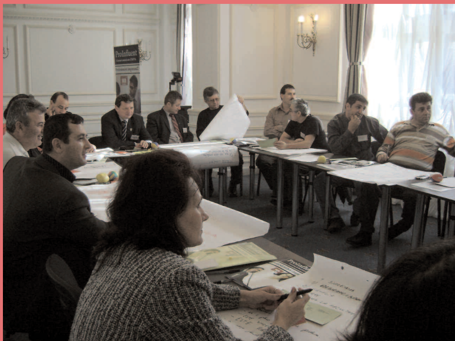
Documentare și concentrare. Nici un experiment nu reușește fără ele, mai ales că pentru atestare se dă și examen

În cadrul cursului, dezbaterile și tehnicile interactive s-au desfășurat pe module de inițiere și aprofundare, remarcându-se încă o dată dorința de a învăța, abilitățile de comunicare activă și ascultare a ideilor