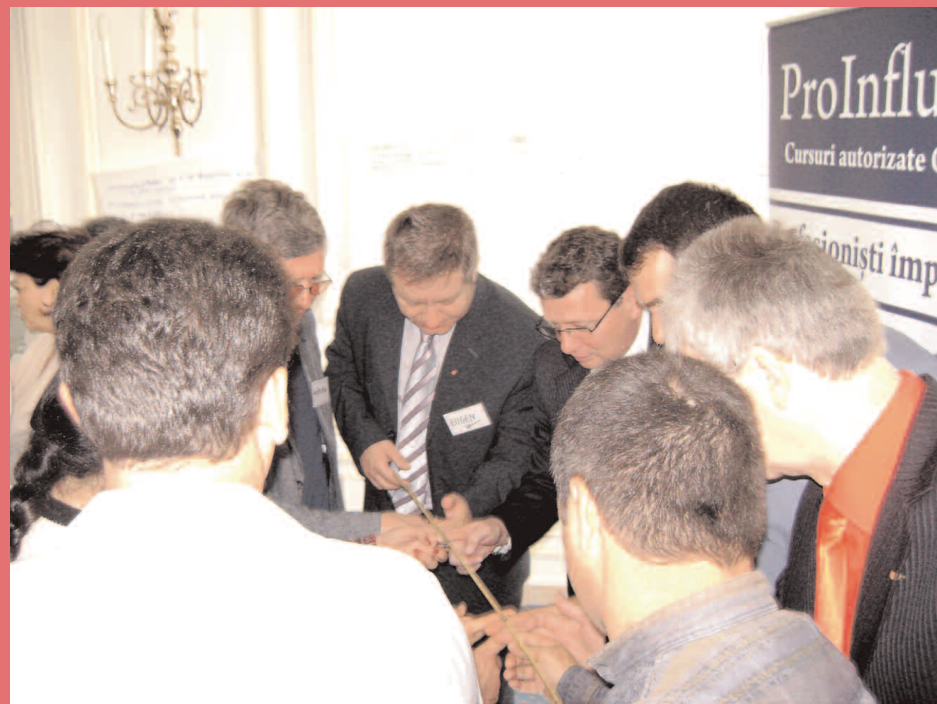
Teoria ca teoria, însă probele practice nu presupun numai știință, ci și aptitudini, pentru că dacă nu ai aptitudini nu poți face nici măcar politică

Lucrările de încheiere ale cursului s-au finalizat cu orele de testare și consiliere individuală și în grup, scoțând în evidență încă o dată, dacă mai era nevoie, unitatea grupului aleșilor noștri locali, capacitatea observării nevoilor reale și a spiritului constructiv al cetățeanului, acestea putând fi înțelese astfel printr-o atitudine corectă și coerentă,