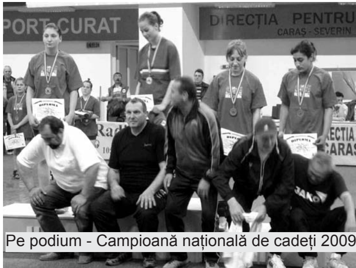
Pe podium - Campioană națională de cadeți 2009