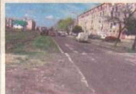
Așa arăta Strada Macului... 5 Aprilie 2006

Multe proiecte implementate de Consiliul Local Motru, respectiv Primăria municipiului Motru, au avut o finalizare de excepție fiind modele pentru alte