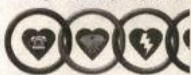
Figura 1: Lanțul supraviețuirii

Reușita resuscitării este determinată nu doar de efectuarea corectă a tehnicilor resuscitării ci de mult mai mulți factori care se află în interrelație. Toți factorii care interfera cu reușita resuscitării sunt cuprinși în noțiunea de lanțul supraviețuirii. Acest „lanț” este format din 4 verigi (figura 1)