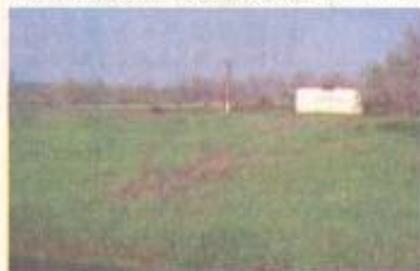
Lângă Stația de Epurare - Lunca Motrului... Aici se va realiza Stația de reciclare și transfer a deșeurilor la Motru.

Primul proiect se intitulează „Motru oraș ecologic, european” și face parte din Programul Phare 2004 Coeziune Economică și Socială „Schema de Investiții pentru Proiectele Mici de Gestionare a Deșeurilor (Faza extinsă)”, CONTRACTUL DE GRANT MIE nr. 43218 din 29.11.20036 „Grant Contract External Operations of the European Community”, PHARE/2004/016-772.04.01.04.01.01.4. Scopul proiectului este acela de a reduce impactul depozitelor