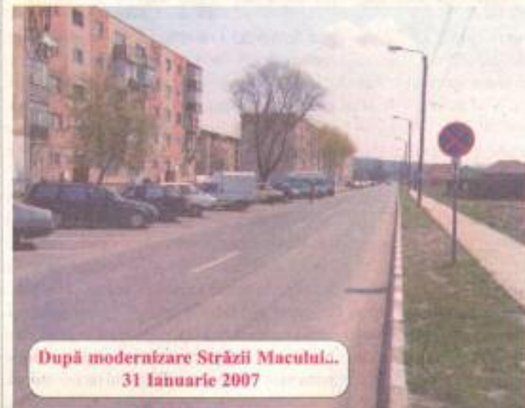
După modernizare Străzii Macului... 31 Ianuarie 2007

administrații. Totuși, cel mai important cu impact final deosebit este „MODERNIZARE STRADA MACULUI, L=1.4 KM”, Programul PHARE 2001 Coeziune Economică și Socială - Schema