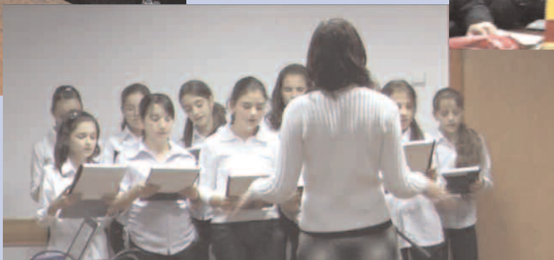
Foto: elevi și profesori de la Colegiul Național "George Coșbuc" și Școala Generală nr. 1 s-au întâlnit la Casa de Cultură pentru o seară literar-muzicală dedicată marelui poet