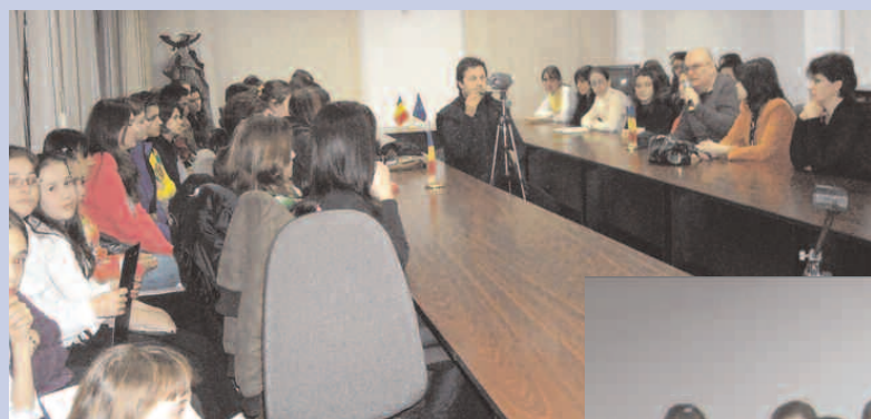
Eminescu, sărbătorit prin vers și cântec