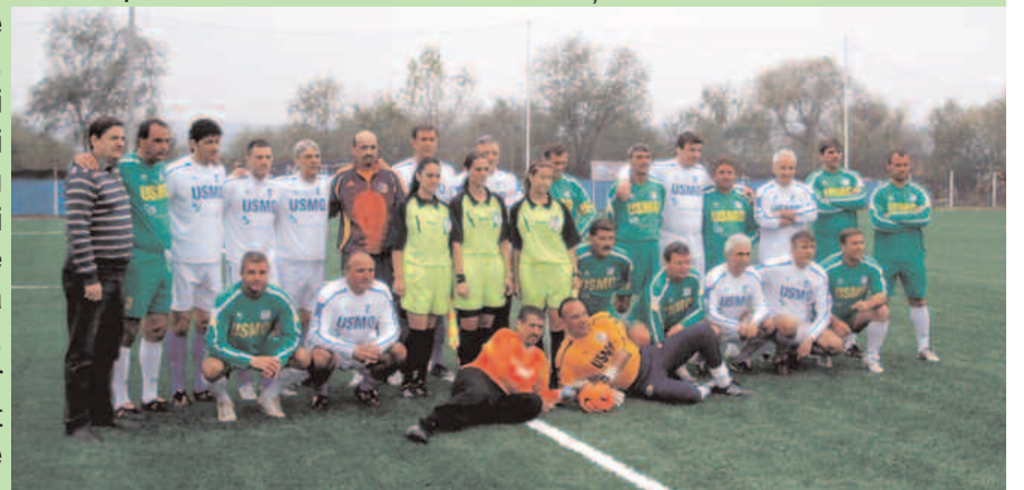
Naționala României versus Combinata Minerit - Politică