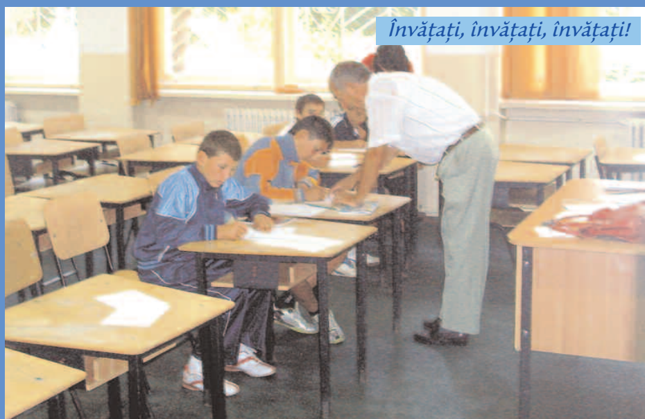
Învățați, învățați, învățați!