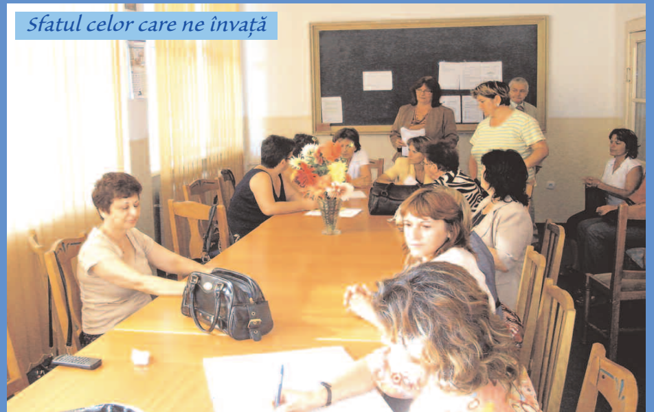
Sfatul celor care ne învață