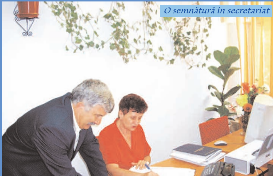
O semnătură în secretariat