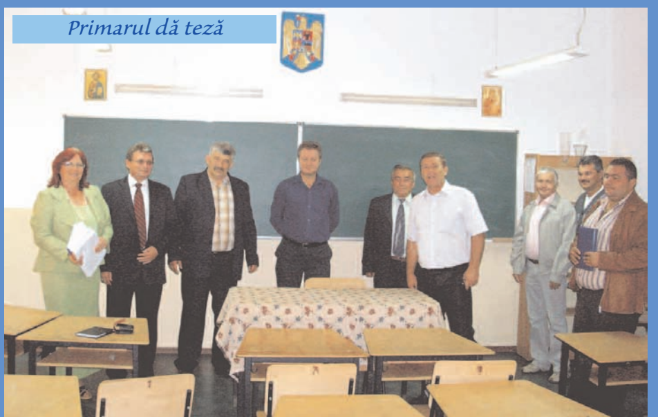
Primarul dă teză